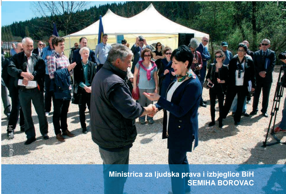
Ministrica za ljudska prava i izbjeglice BiH SEMIHA BOROVIĆ

Više od polovine prijeratnog domicilnog stanovništva je u periodu od 1992. do 1995. godine prinudno napustilo svoje domove u Bosni i Hercegovini, a otprilike 98.000 osoba još je uvijek u statusu interno raseljenih osoba, što BiH svrstava među zemlje sa najvećim izbjegličko-raseljeničkim problemom u Evropi.