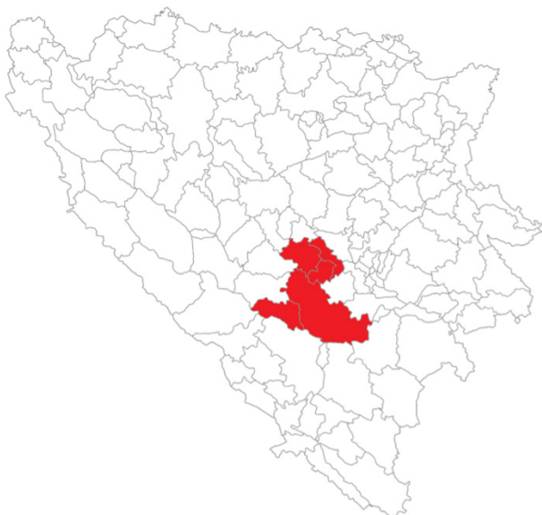
Općine pogođene poplavama i klizištima 4. oktobra.

Po nalogu Federalnog štaba civilne zaštite Federacije BiH, sve službe zaštite i spašavanja u FBiH mobilizirale su ljudske i materijalne resurse za djelovanje u pogođenim područjima 5 . Društvo Crvenog križa Federacije Bosne i Hercegovine organiziralo je punktove za prikupljanje pomoći, a 206 zaposlenih i volontera/ki pruža podršku u pogođenim područjima.